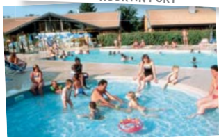
PISCINE (accès illimité pour résidents des chalets)