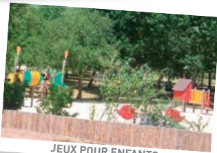
JEUX POUR ENFANTS