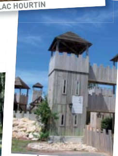
ÎLE AUX ENFANTS (accès gratuit)